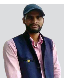
संजयले यसरी पुरा गर्नुभयो प्रदेश सभा सदस्यसम्मको सफल