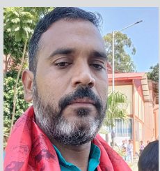
माओवादीलाई बाहिर भित्र दुबै ठाउँबाट धोका