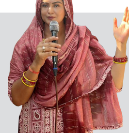
अधिकांश सिनेकर्मीको जमानत जफत