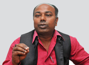
संसदमा आएका केही व्यक्तिका कारण संघीयता तथा हिचानवादीलाई चिन्तित बनाएको छ