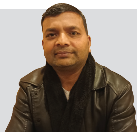
जसपाले उपराष्ट्रपतिमा दावी गर्नु स्वभाविक अधिकार हो