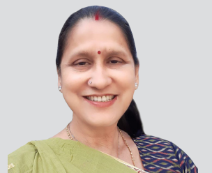
स्वभिमानका लागि रञ्जुले गर्नुभएको संघर्षका कथाहरु