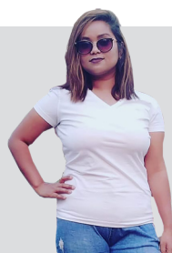
बेलाबेला रमितालाई मुर्छित बनाउने त्यो काठमाडौँ