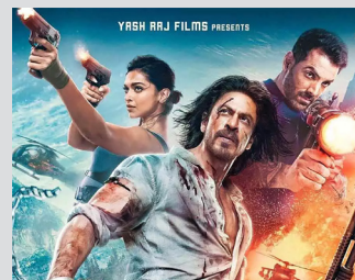
पठानले गरे रेकर्ड ब्रेक