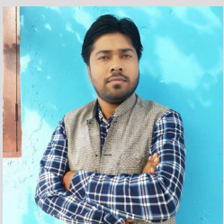
यो सरकार यसरी बन्थो चिनियाँ समर्थक