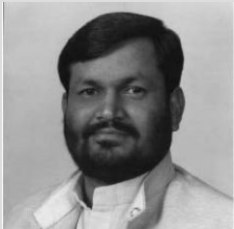
भारत भ्रमणलाई विवादमा ल्याउनु पूर्वाग्रही सोच हो