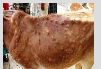
लम्पी स्किन रोगको प्रकोपा