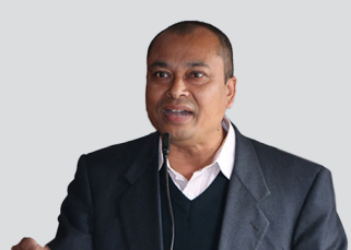
हामीले मधेश सरकारलाई काम गर्ने मौका दिएका हौं