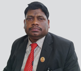
अहिलेको संसदीय अभ्यासले हाम्रो चित्त दुखेको छ