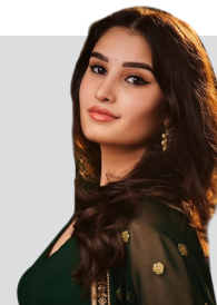
रविनाको छोरी थडानी फिल्ममा