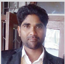
नेपालको राष्ट्रिय जनगणना २०७८ र मैथिली भाषाको अवस्था