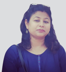
विजेताको अन्तिम इच्छा, 'पत्रकारिता गर्दा गर्दै मन पाउ'