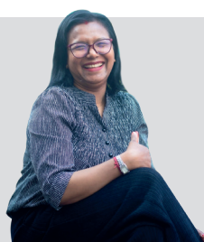
नर्सिन पदम हिड्नु भएको पावता यसरी बन्नुभयो पत्रकार