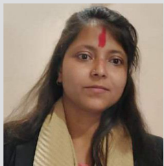
देशका तीन स्तम्भ संघीयता, समावेशी र सुशासन