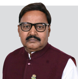
खुशी यो कारणले छ कि म मधेशको साथमा छु