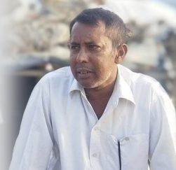
रामबालक सर जसले क्रान्तिको बीज छरेर जानुभयो