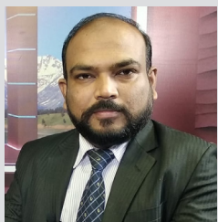
मधेशले उपेन्द्रलाई त्यागे कि उपेन्द्रले मधेशलाई ?