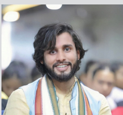
नेपालका महिला र संवैधानिक अधिकारी