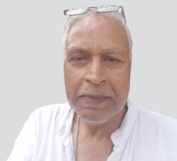
उपेन्द्र र गजेन्द्रको तुलना गर्न सकिदैन