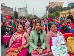
आफ्नो लागि लड्दा लड्दै अरुको लागि आवाज बन्नुभयो कितिमा