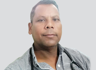
नागरिकमा सेवाप्रति भरोसा र विश्वास जगाउन सफल पण्डित