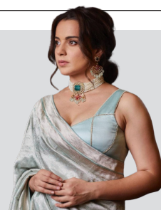
कङ्गनाको सर्वाधिक फ्लप फिल्म 'तेजस'