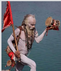
१२ वर्षमा एक पटक लाग्ने चतराको महाकुम्भ मेला