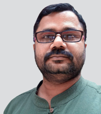
देश मधेश र पार्टीमा उपेन्द्र यादवको विकल्प खोज्ने बेला भएको छैन