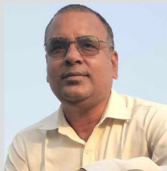
८४ का लागि एक पटक संगठित हुने हो कि !