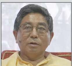
यसकारणले विभाजन भयो जसपा नेपाल