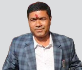
गठबन्धनको राजनीतिले काम गर्न गाह्रो छ