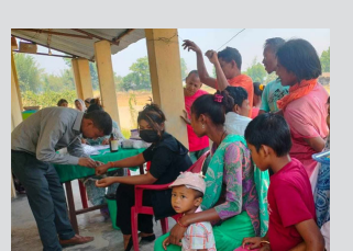
सिकलसेल रोगले लिदैछ ज्यान, सरकार बेखबर