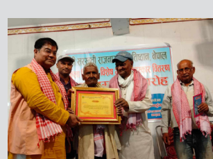
मधेशका कलकार सम्मानित