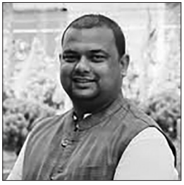
■ किशोर गुरु