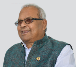
मधेशी दलको बिचमा एकता हुनु बाहेक अर्को कुनै विकल्प छैन