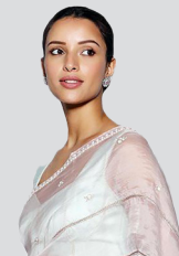
लोकप्रिय स्टारको सूचीमा तृती डिमरी