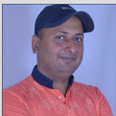
नेपाल-भारतबिचको अद्भुत सम्बन्ध