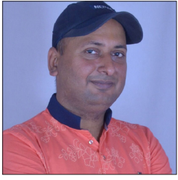
■ सुजीतकुमार मा