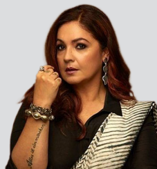
हिन्दी सिनेमामा महिलाको यौनिकता